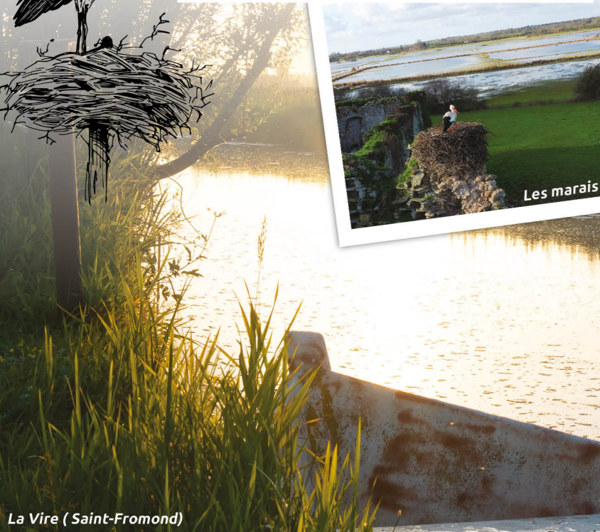
La Vire (Saint-Fromond)