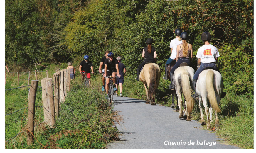
Chemin de halage

Natuurliefhebbers: de vallei van de Vire wacht op jullie! Te voet, te paard of met de fiets, maak een tochtje langs de Vire en laat je verrassen door het afwisselende natuurlandschap rond de rivier. Terwijl de grootste waaghazens de rivier proberen te bedwingen aan boord van een kano, kayak of paddle, reizen anderen liever over de oude spoorlijn met een velorail. Dit speelt- en ontdekkings terrein dat fauna, flora en erfgoed combineert, zal je in verrukking brengen tijdens een verkwikkende vakantie.