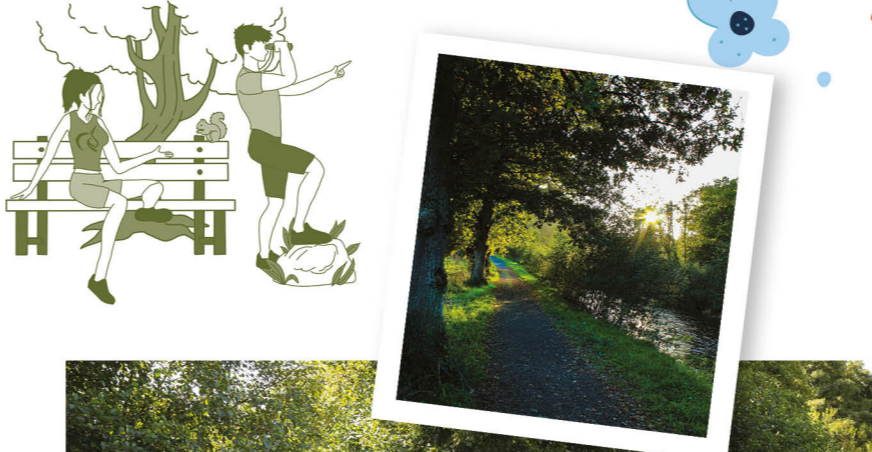
Les bords de Vire

Het zuidelijke deel van het gebied, gevormd door eeuwenlange landbouw, heeft zijn identiteit weten te bewaren. De groene landschappen, bosgebieden en holle weggetjes zijn als gemaakt voor wandelaars. Zijn identiteit zit ook in de vakkennis van de producenten, die u uitnodigen om de vele smaken uit de streek te komen proeven (cidre, calvados, karamelsaus, chocolade...). Deze streek van contrasten lukt het verbaasend goed om verleden en heden te combineren, zoals zijn cultureel centrum de TESSY-BOCAGE, vroeger een cidreriefabriek, waar tegenwoordig moderne artiesten elkaar inspireren, en creëren (Usine Utopik).