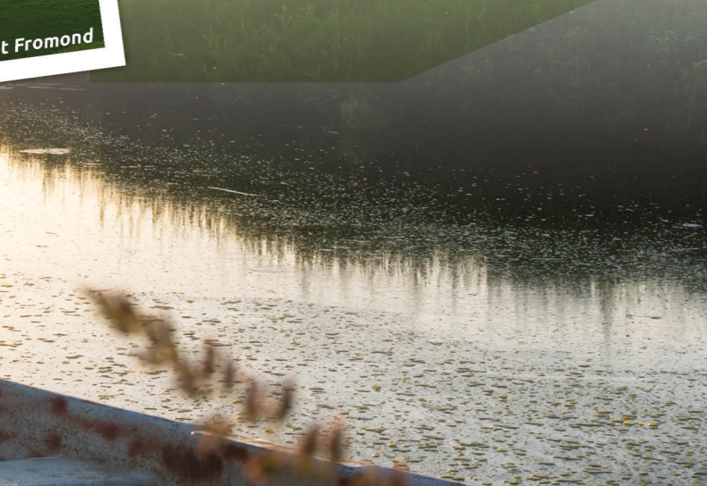
Les marais - St Fromond

Ontdek de oeveraarskolonie! Je ziet ze bij het Château de la Rivière in Saint-Fromond.