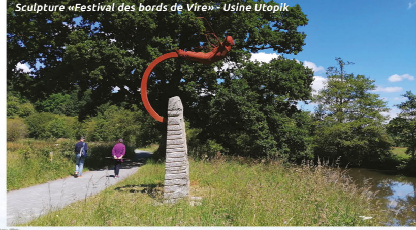
Sculpture «Festival des bords de Vire» - Usine Utopik