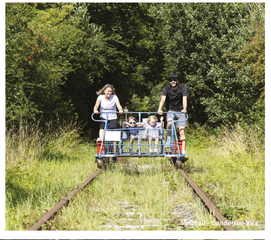
Vélorail - Condes-sur-Vire