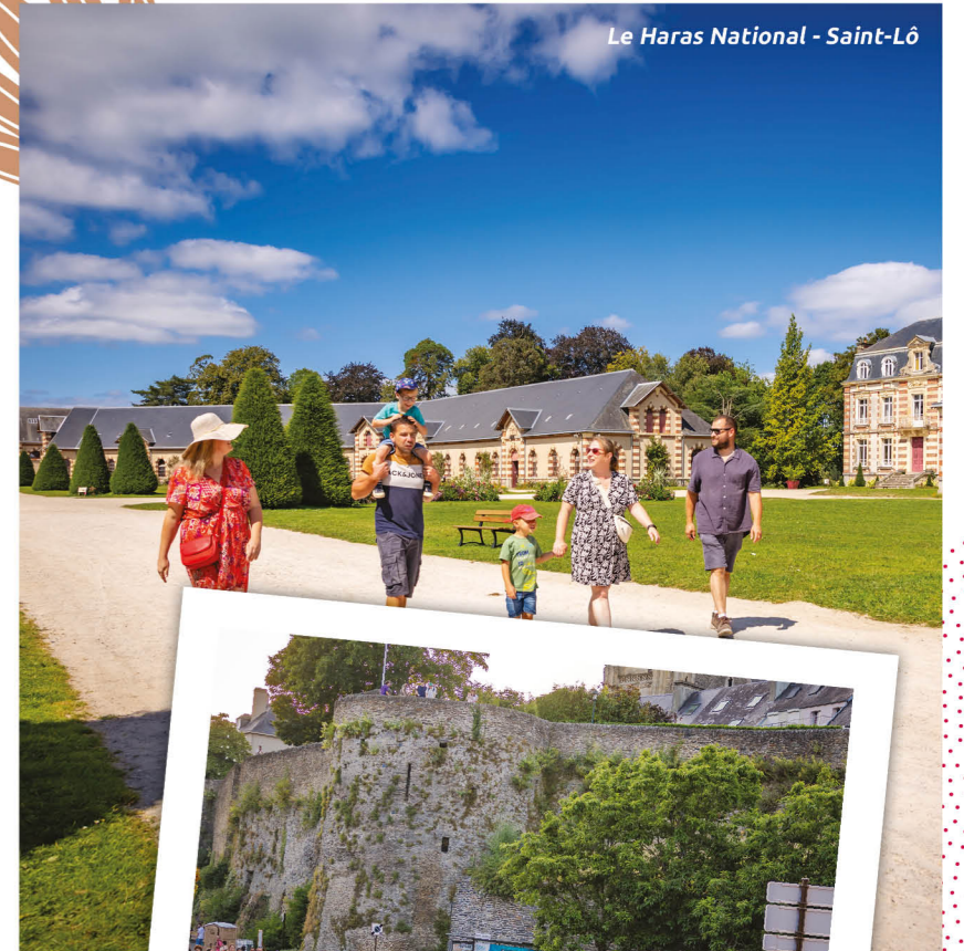
Le Haras National - Saint-Lô

Midden op het schiereiland Cotentin heerst de stad Saint-Lô van boven zijn stadsmuren over de Vire. De prefectuurstad, waar de geschiedenis diepe sporen heeft achtergelaten, is uit zijn as herrezen en richt zich op een kleurrijke toekomst. Tegenwoordig is ze een combinatie van oude schatten, en architectonische hoogstandjes van de wederopbouw. een waar openluchtmuseum. Zijn stoeterij organiseert paardenevenementen van hoge kwaliteit. Ontdek de geheimen van de stad, en de eeuwenoude tradities in zijn museum, stadsmuren en overblijfselen. De nachtrijkers wacht een druk programma: theater, concerten, festivals... Beleef de kunst van helemaal losgaan op z'n Saint-Loos!!!