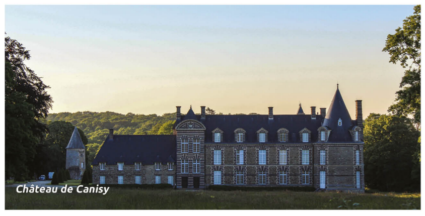
Château de Canisy

Imprégnez-vous de l'histoire de la Seconde Guerre mondiale à travers le Mémorial Cobra et le cimetière allemand dans lequel reposent près de 11000 soldats. Découvrez les savoir-faire traditionnels à l'image de l'osier et du travail de la vannerie en visitant le musée dédié à ce patrimoine vivant.