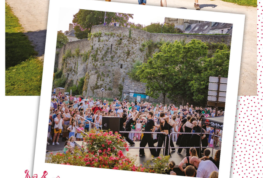
Saint-Lô, au rythme de la fête de la musique!