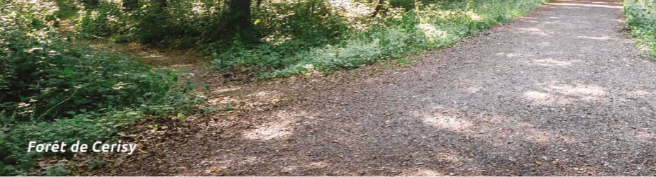
Forêt de Cerisy