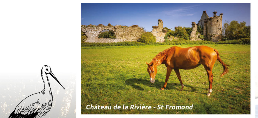
Château de la Rivière - St Fromond

Wanneer de uitgestrekte groene vlakten plaats maken voor drassig wintergrond, gaan de hemel en het water in elkaar op, en laten het hart van het moeras weerspiegelen. Deze bijzondere landschappen zijn een uitnodiging om erop uit te gaan en de opmerkelijke flora en fauna te ontdekken, dat hier door de seizoenen heen leeft.