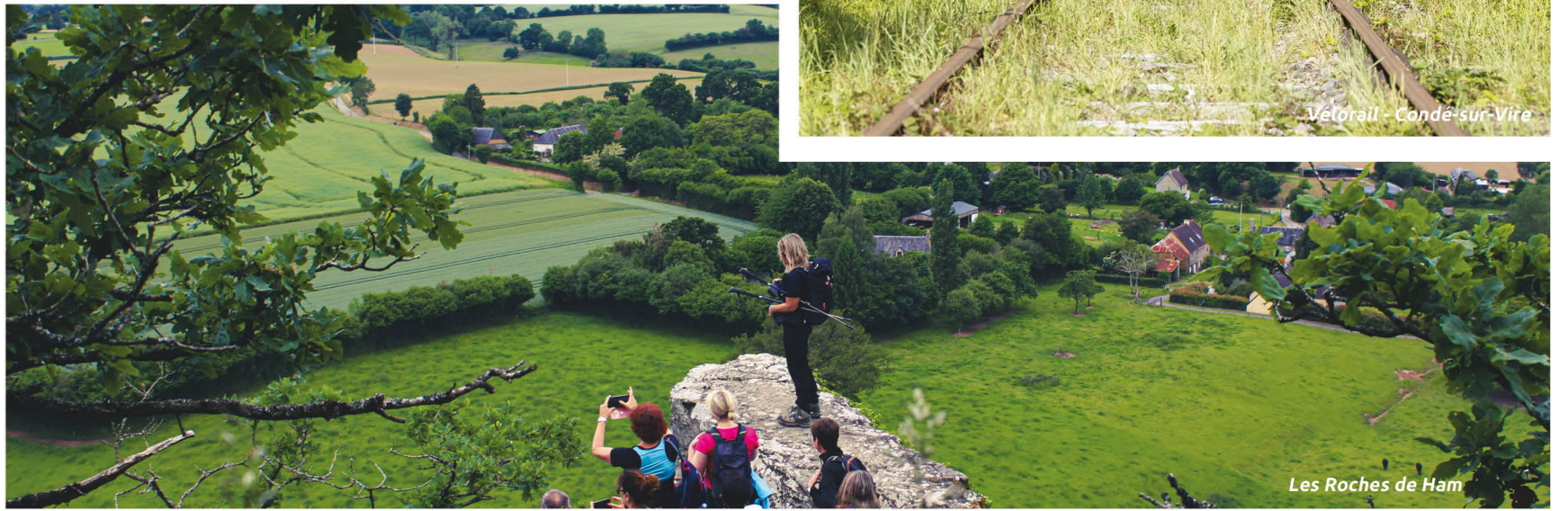
Les Roches de Ham