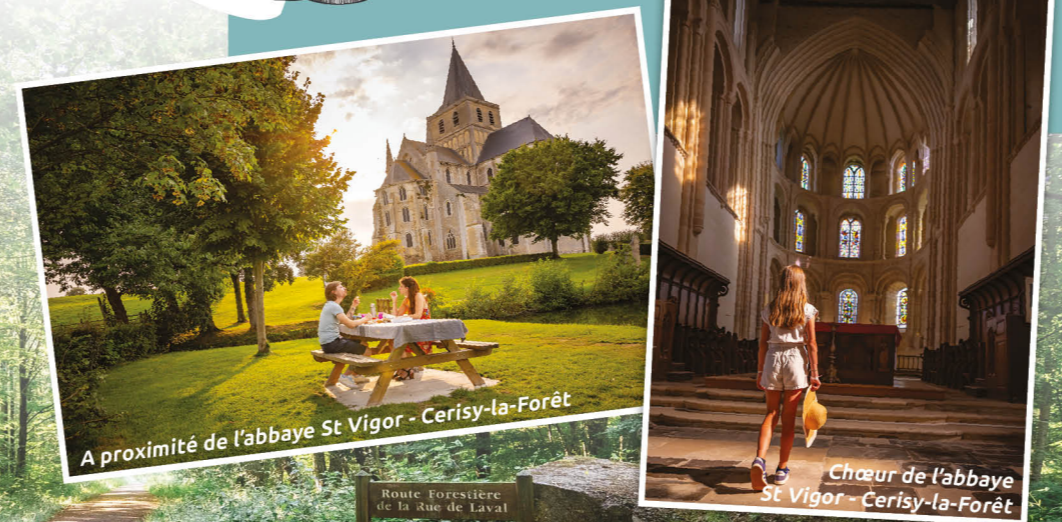
A proximité de l'abbaye St Vigor - Cerisy-la-Forêt