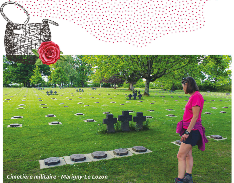
Cimetière militaire - Marigny-Le Lozon