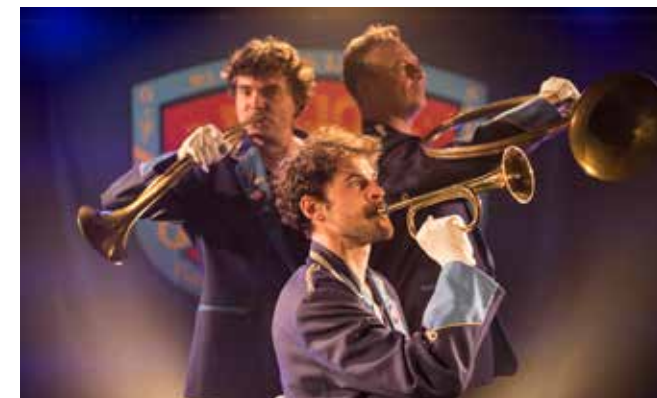
L'appel du clairon éternel