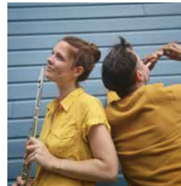
L'Arc-en-ciel d'Anatolie